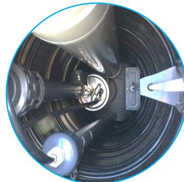
Option Irrigation avec système IRRIGO Evolution®

INSTALLATION : En complément de la notice de pose fournie avec l'unité d'épuration, l'installateur devra respecter les règles du DTU 64.1. « Mise en œuvre des petites installations d'assainissement autonome ».